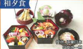
夕食の一例