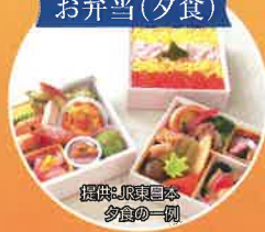
夕食の一例

客室でお弁当のご夕食をお楽しみいただくこともできます。 ※カシオペアツインでお申し込みのお客様のみとなります。詳しくは裏面をご覧ください。