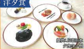
夕食の一例